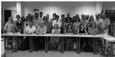
Foto de famílies amb tots i totes les ponents de la jornada.

elperiodic.adnoticia/10054/diverses-ponencies-en-la-36a-diada-andorrana-a-la-55a-universitat-catalana-d'estiu