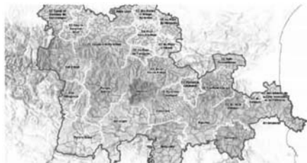
Mapa del territori de l'Àrea Funcional de Muntanya Est del programa Interreg Poctefa. | Interreg Poctefa

elperiodic.ad/index.php/100740/andorra-potenciar-a-l-area-funcional-andorra-i-potenciar-el-programa-interreg-poctefa