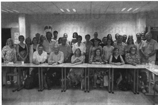
ELS PONENTS QUE VAN PARTICIPAR A LA DIADA ANDORRANA A L'UCE.

Pel que fa al col·lectiu de dones, la parlamentària veu ben resolt tant el sufragi actiu (dret a votar) com el passiu (les persones a ser candidades). I és que, a parer seu, s'estan assolint bons resultats de representació política femenina, fins i tot abans de les quotes establertes legalment. "No obstant això, la incorporació tardana de les dones en l'esfera