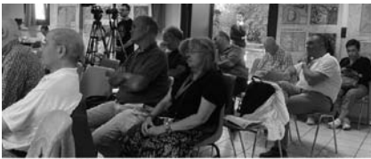
UN MOMENT DE LA DIADA ANDORRANA A PRADA EN UNA EDICIÓ ANTERIOR