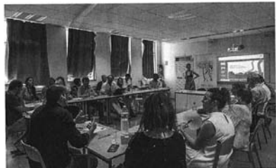
Les Jornades Andorranes, convertides en un clàssic de l'UCE