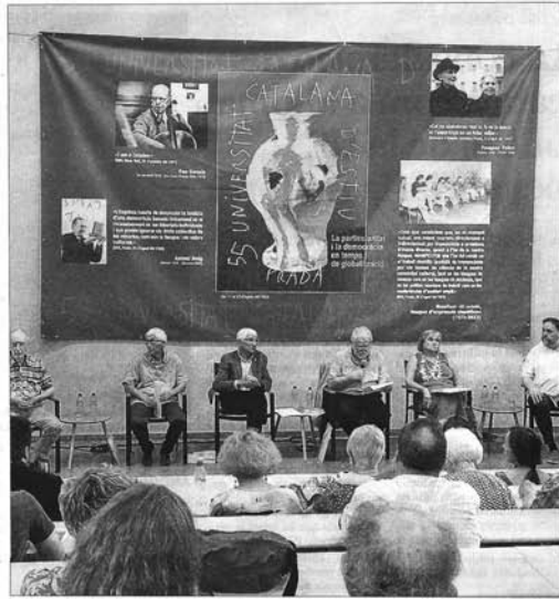
El dia de la inauguració de la Universitat Catalana d'Estiu.

La ponència de Ronchera posa també de manifest una altra realitat: que hi ha molts més homes en càrrecs directius (13,4%, per un 5,7% de dones); en canvi, les dones predominen en feines no qualificades, on són un 14,5% per un 5% d'homes. A més, els homes continuen dedicant mol-