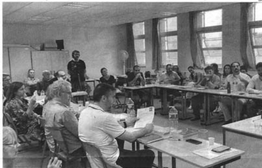
Un moment de la Diada Andorrana a la Universitat Catalana d'Estiu a Prada de Conflent.

Aquesta diada, organitzada per la Societat Andorrana de Ciències, va ser per a alguns una oportunitat de promoure la seva organització i per debatre i fer preguntes sobre temes d'actualitat. Aprofitant l'ocasió, es va parlar d'altres temes, com per exemple l'avortament, la presència de mediació