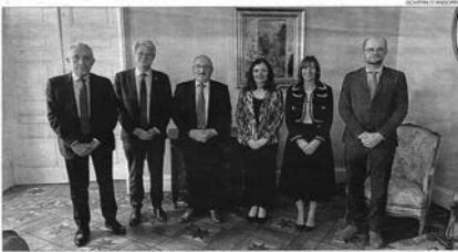
Les delegacions d'Andorra i dels Pirineus Orientals durant la seva tobacco a Perpieny.