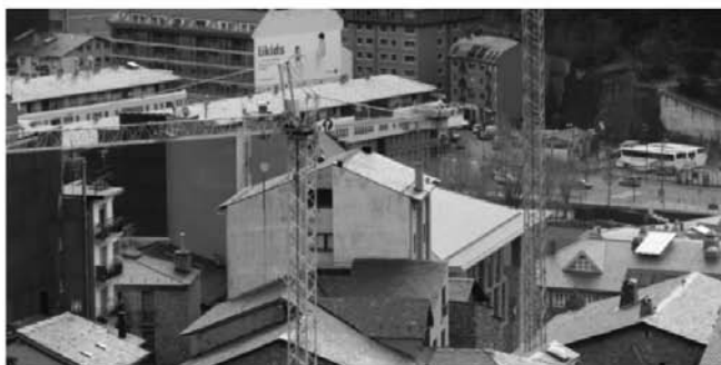
Grues en una construcció a Andorra la Vella.