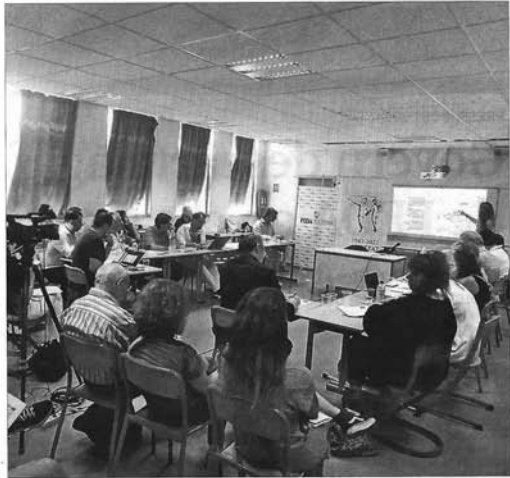
Un moment de la diada andorrana a la Universitat Catalana d'Estiu.

"L'accés a un habitatge digne comporta per a la majoria de les famílies una despesa molt important, en proporció al seu salari, que els porta a haver d'estalviar en despeses bàsiques i necessàries. Pensem en electricitat, calefacció, educació, esport... no dir sanitat i alimentació", va afegir. Tot plegat fa que moltes per-