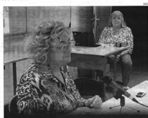
● La secretària general de l'Institut Andorrà de les Dones.