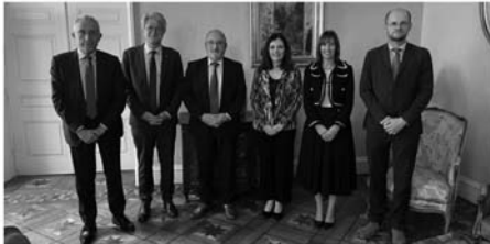
Les delegacions d'Andorra i dels Pirineus Orientals durant la seva trobada a Perpinyà. | Govern d'Andorra>

elperiodic.ad/noticia/102175/tor-es-desplaca-a-perpinya-per-reforzar-la-cooperacio-amb-els-pirineus-orientals