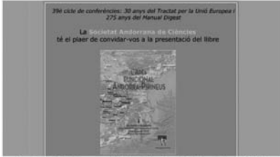
Cartel anunciador de la presentació del llibre "L'àrea funcional Andorra Pirineus: 35a Diada Andorrana" (SAC)

PER: REDACCIÓ / EL 07/08/23 22:28 / A: SOCIETAT